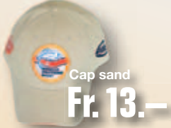
Cap sand Fr. 13.-

Mit der Brevet-Bekleidungs- linie machen Sie nicht nur am Wasser eine gute Figur. Bestellen Sie jetzt die modi- sche Fischerbekleidung für Sie und Ihn zum unschlagbar günstigen Preis.