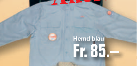
Hemd blau Fr. 85.-