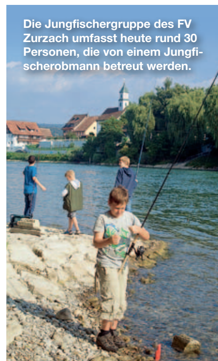
Die Jungfischerguppe des FV Zurzach umfasst heute rund 30 Personen, die von einem Jungfischerobmann betreut werden.