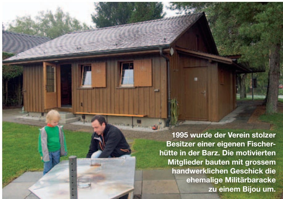
1995 wurde der Verein stolzer Besitzer einer eigenen Fischerhütte in der Barz. Die motivierten Mitglieder bauten mit grossem handwerklichen Geschick die ehemalige Militärbaracke zu einem Bijou um.

Der FV Zurzach blickt auf eine 76-jährige Geschichte zurück. 1937 wurde der Verein von sieben Fischern aus Zurzach und Rekingen gegründet. Im selben Jahr wurde auch mit dem Bau des Kraftwerks Rekingen begonnen, ökologische Folgeschäden hatten sich der Stromproduktion unterzuordnen. Das Kraftwerk lancierte 1985 das Projekt Leistungssteigerung um 25%, was die Aussichten für die Fischer trübte. Für die Realisierung dieses Projekts war die Ausbaggerung der Rheinsohle auf rund 2,7 km von Rekingen nach Zurzach vorgesehen. Der FV