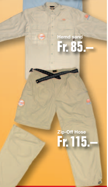
Hemd sand Fr. 85.-