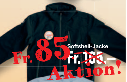
Fr. 85.- Fr. 100.- Softshell-Jacke Aktion!